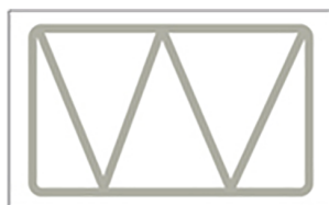
corretta applicazione di THERMO FIX 900